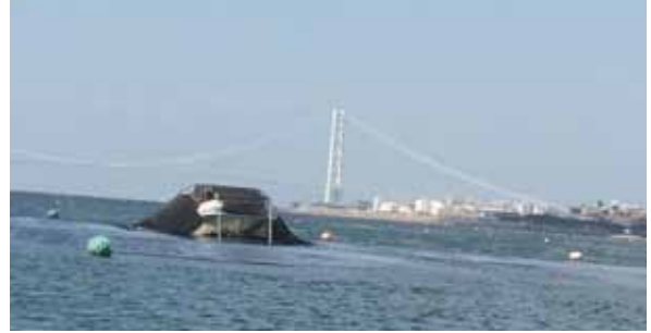
海苔網の下をくぐって海苔を刈るもぐり船と 明石海峡大橋